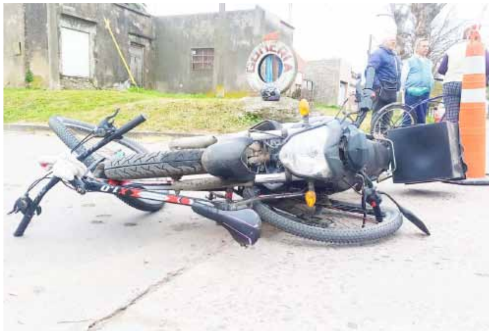
Dos vistas de cómo quedaron los vehículos involucrados.