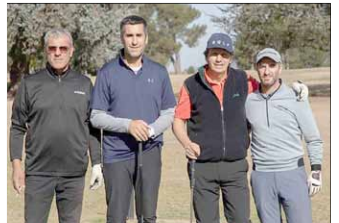
Presencias bolivarenses en el torneo.