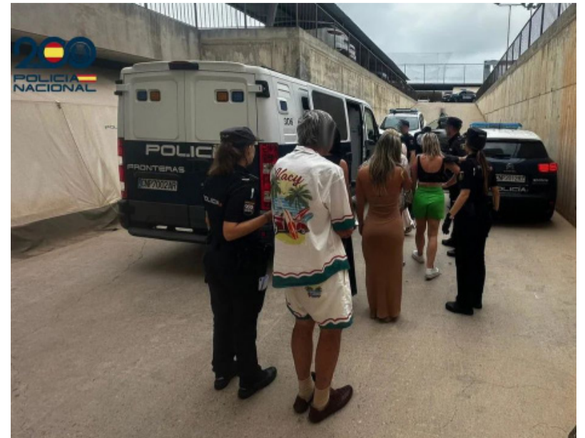
En Ibiza. Detuvieron a varios turistas

Dos argentinas fueron detenidas en Ibiza, España, junto a otros cuatro turistas por no pagar una cena de 12 mil euros. Fuentes policiales locales informaron que los seis comensales comieron en un reconocido restaurante y al momento de abonar dieron una insólita justificación.