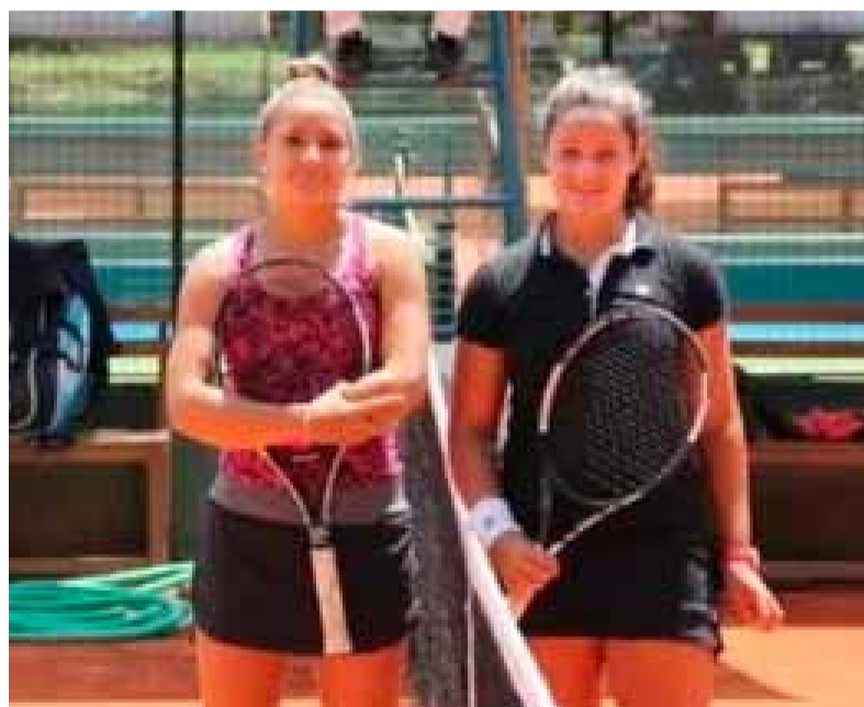
Suspendidas. Las jugadoras de nuestro país

Por su parte, Luini se opuso a las 24 acusaciones en torno a seis partidos en 2017 y 2018 en los que se le culpaba de los mismos cargos que a su compatriota. Ambas jugadoras están suspendidas a partir del 23 de julio, fecha en que se emitieron