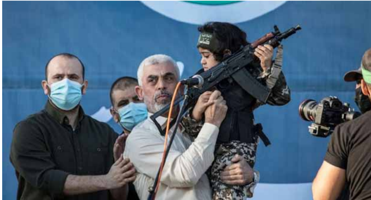
Jefe. Yahya Sinwar nuevo líder del grupo terrorista

Yahya Sinwar será el conductor en sustitución de Ismail Haniyeh