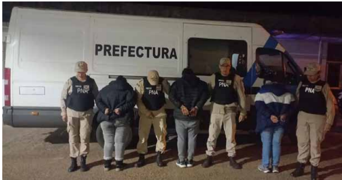
Cuatro allanamientos. Realizó la Prefectura Naval en Corrientes

Fue en Monte Caseros, Corrientes, y hay tres detenidos