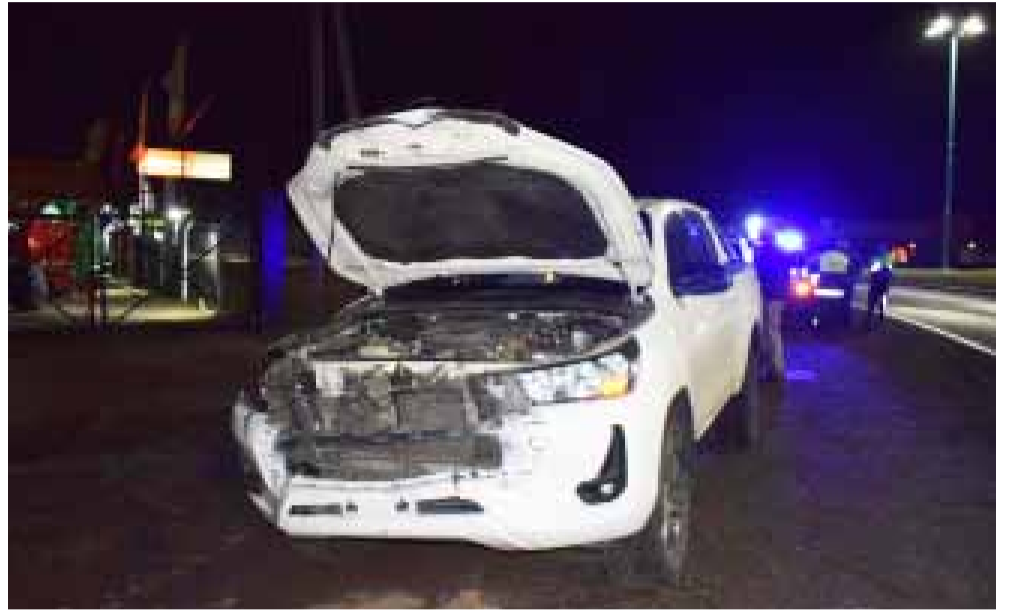
PARQUE LAS ACOLLARADAS

una brusca maniobra que tuvo que efectuar el conductor de la pick up para evitar embestir a un motociclista que huyó del lugar. Ello derivó en la pérdida de control del rodado que terminó embistiendo y