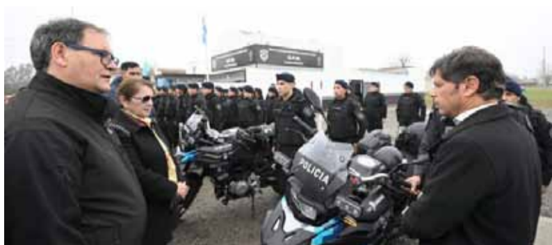
Seguridad. El gobernador Kicillof, junto al ministro de Seguridad bonaerense, Javier Alonso

En el marco del acto, Kicillof dijo que "hay sectores que siempre hablan de lo importante que es la seguridad, pero que cuando