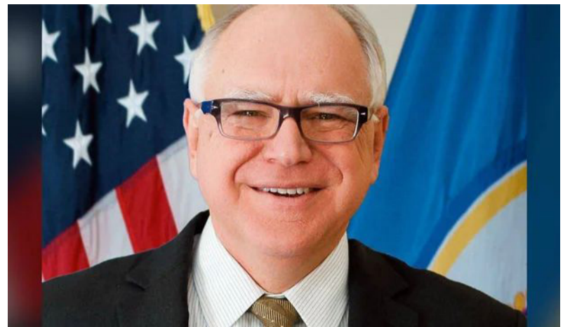
Tim Walz. Compañero de fórmula

La vicepresidenta de los Estados Unidos, Kamala Harris, eligió al gobernador de Minnesota, Tim Walz, como su compañero de fórmula presidencial, de acuerdo con diversos reportes de medios informativos estadounidenses.