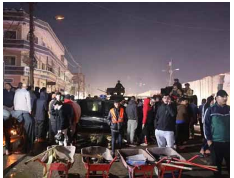
Epicentro. Irak lleva años en medio de la tensión entre Medio Oriente y occidente

Al menos cinco efectivos estadounidenses resultaron heridos en un ataque contra una base militar en Irak que se produjo en las últimas horas.