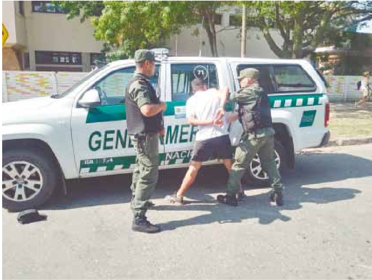
Indice delictivo. Un menor en momento en el que es demorado

Según el Sistema Nacional de Información Criminal (SNIC)