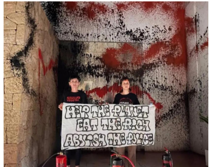
Pintadas. En la casa de Messi de Ibiza